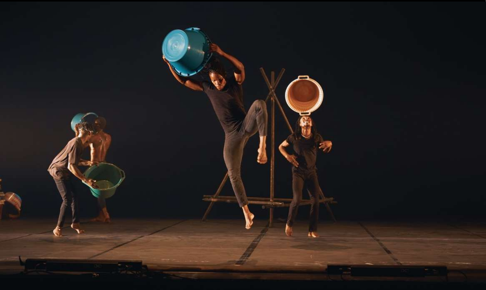
Théâtre Tropiques Atrium de Fort de France, Martinique, septembre 2022