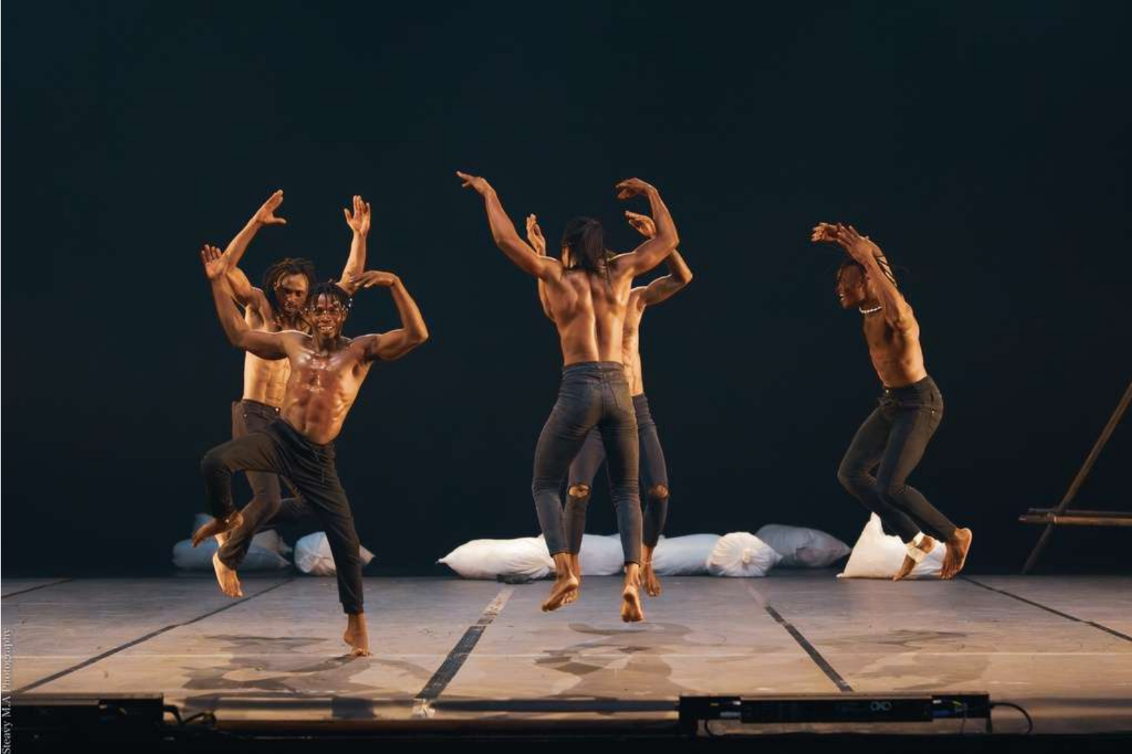
Théâtre Tropiques Atrium, Scène Nationale de Martinique, septembre 2022