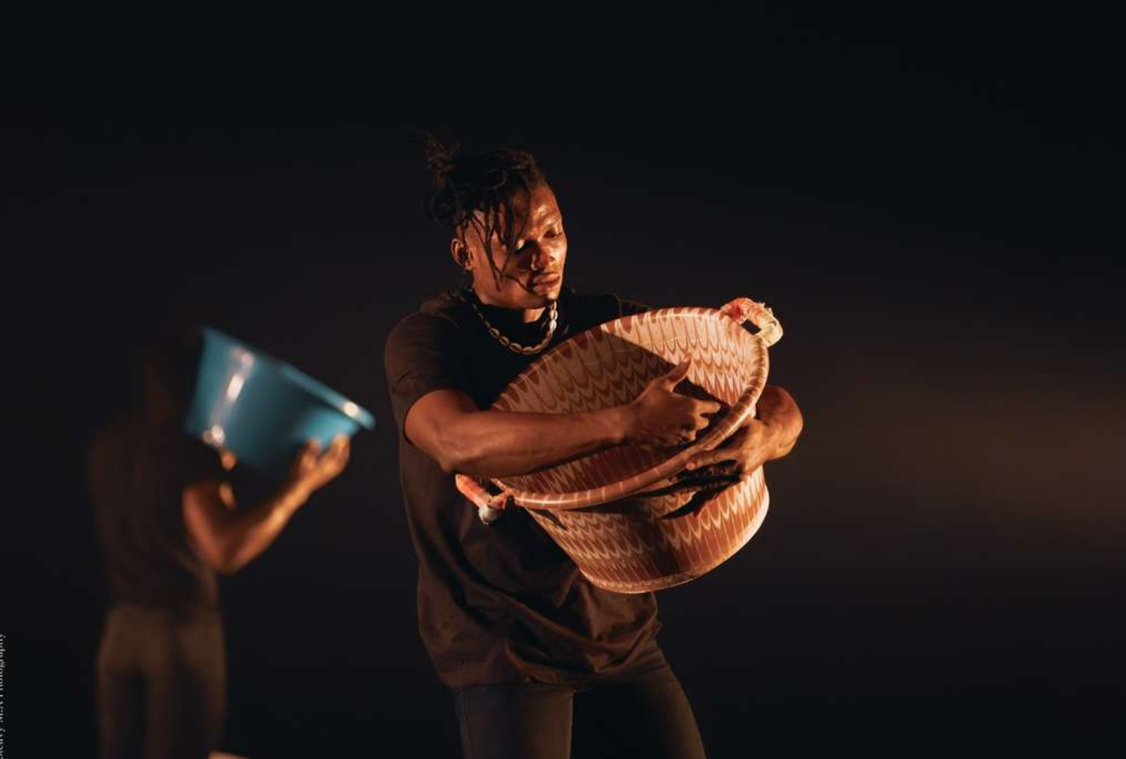
Théâtre Tropiques Atrium, Scène Nationale de Martinique, septembre 2022